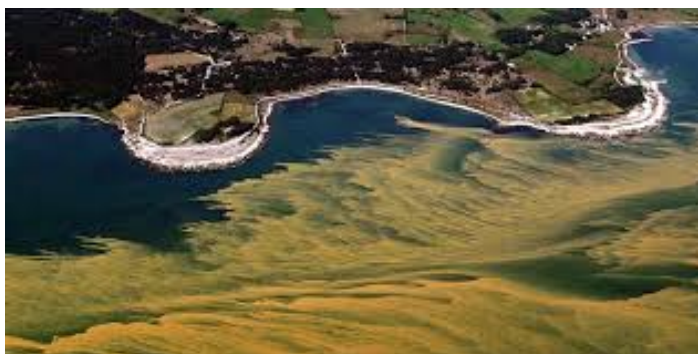
Algblomning sommaren 2018. SMHIs hemsida 16 april 2019

Även om nederbörden faller som under en normal-sommar, kommer vattensituationen troligen inte att förbättras, dock med lokala undantag. Om det blir en liknande torrsommar som under 2018, riskerar vi att uppleva den allvarligaste vattenbristen som har registrerats under drygt 100 år.”