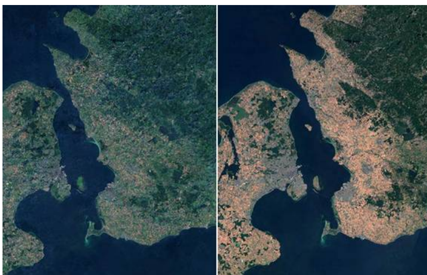
Bilden ovan: Torkans utbredning.